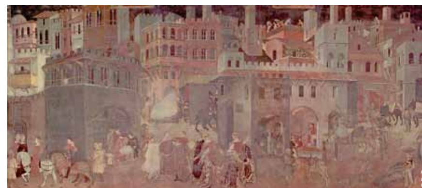
Effets du Bon Gouvernement dans la ville (fresque de Ambrogio Lorenzetti, Sienne, 1338)

En proposant le terme « régulation territoriale », nous voulions inviter les équipes à sortir des chemins trop balisés de l'analyse de la gouvernance et à réfléchir sans contraintes sur les manières d'aborder la structuration du pouvoir local, le gouvernement, la gestion, voire la production des territoires métropolitains.