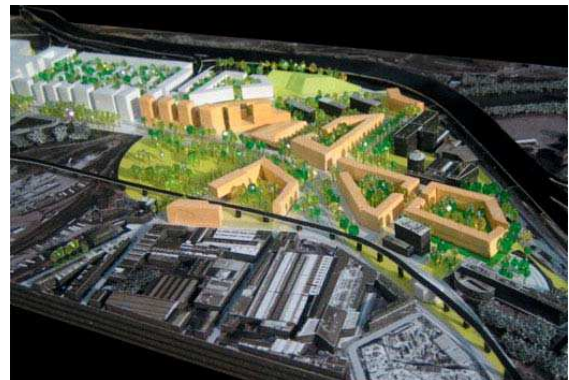
Maquette – Dusapin & Leclercq / Michel Guthmann Architectes Urbanistes