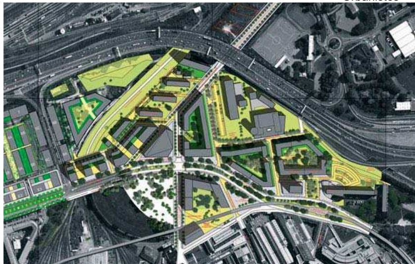
Plan masse – Dusapin & Leclercq / Michel Guthmann Architectes Urbanistes