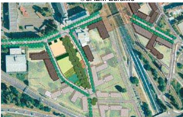
Plan masse du projet ©SAEM Euralille