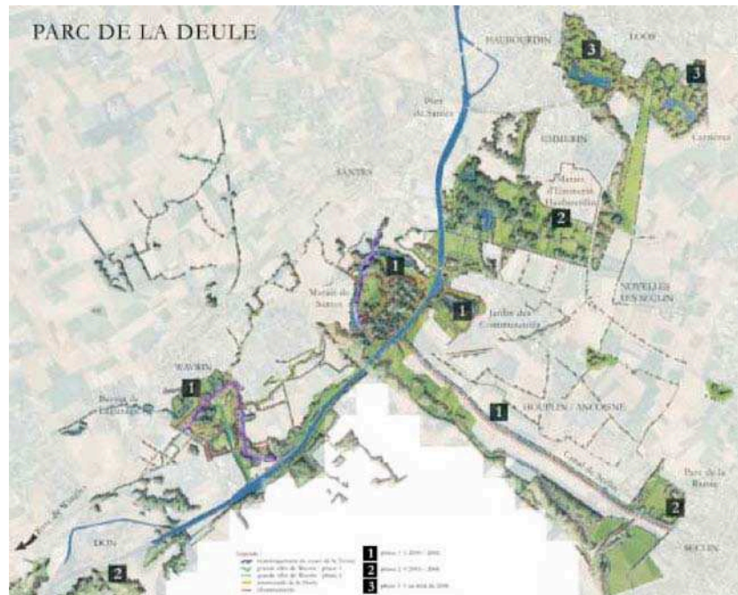
iii. 2 : le parc de la Deule, plan d'ensemble à l'horizon 2015, équipe Jacques Simon/JNC international