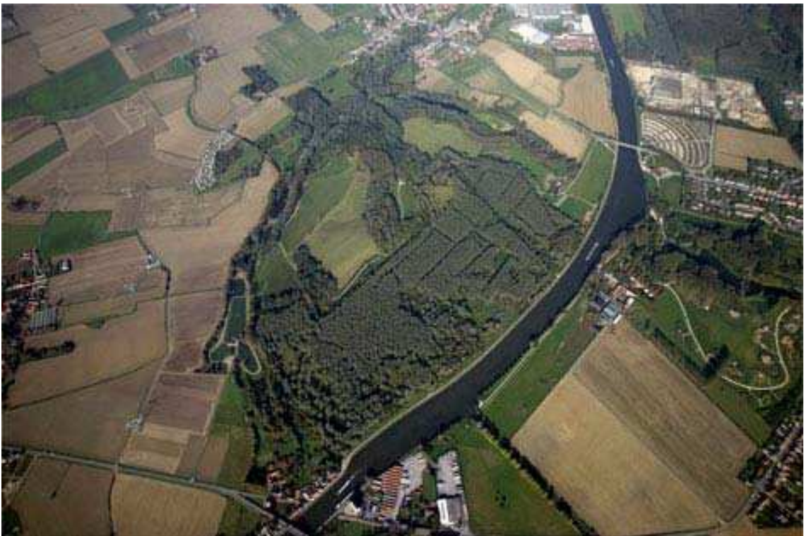
ill. 5 : Le site de Santes et le jardin Mosaïc de part et d'autre de la Deûle