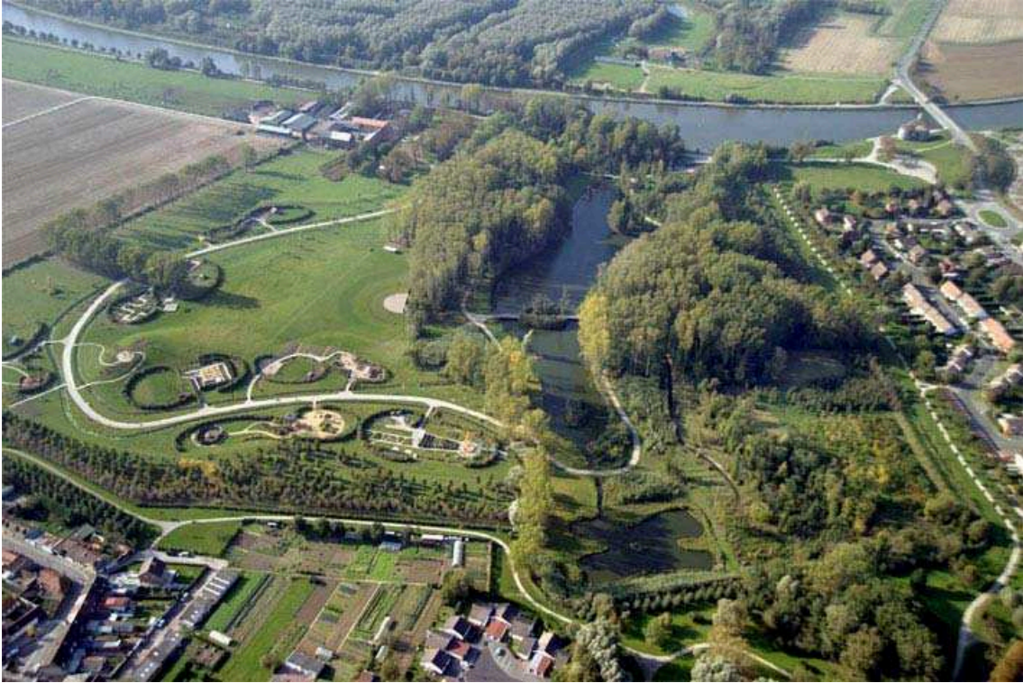
iii. 6 : Le jardin Mosaïc : vue vers la Deûle au Nord-Ouest, photo ©ENLM 2005