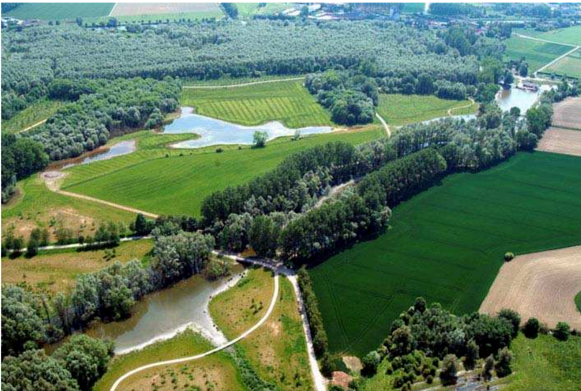
iii. 7 : la Tortue, les étangs de la Gîte, vue vers la Deûle au Sud-Est, photo ©ENLM, 2003