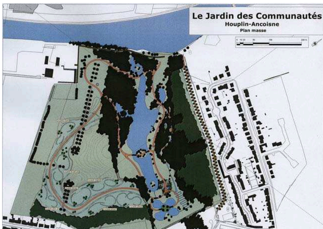
iii. 3 : Le jardin Mosaïc, plan d'ensemble, Jacques Simon, JNC international